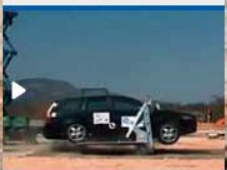
Crash test 1 frame B