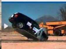
Crash test 1 frame C