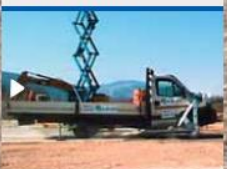
Crash test 2 frame B