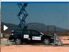
Crash test 1 frame A