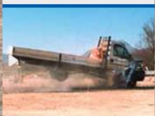
Crash test 2 frame C