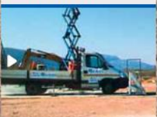
Crash test 2 frame A